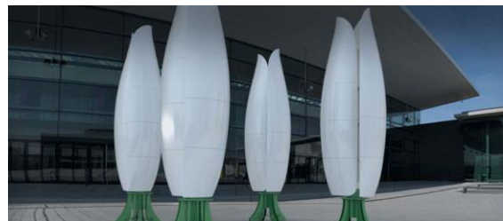
(© Flower Windturbines)